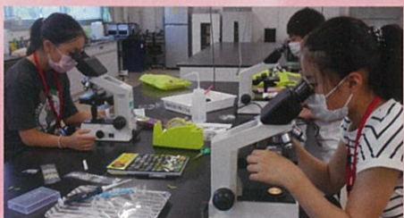
サイエンスキャンプ(川の微生物を観察)